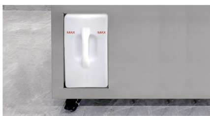
에어포켓 배출 수증기 저감 장치