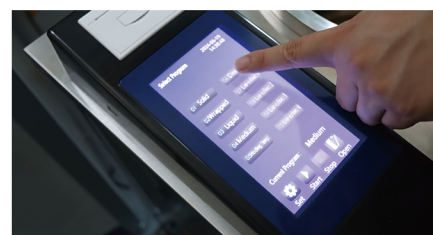
프린터 내장형 LCD 터치 디스플레이